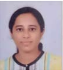
ರೂಪೆಲ್ ವಾಚ್, ಸಾಂ ಫ್ರಾನ್ಸಿಸ್ ಸಾವೆರ್ ವಾಡೊ

ಝಡಾಂಚೆ ಹೆರ್ ಉಪಯೋಗ್ ಆಮಿ ಖಂಡಿತ್ ಜಾವ್ನ್ ಜಾಣಾಂವ್. ದೆಕುನ್ ರೂಕ್ ಝಡಾಂ ರಕ್ಷಣ್ ಕರುಂಕ್ ಹರೈಕ್ ವರ್ಸಾ ಜುಲೈ ಮಹಿನ್ಯಾಚಾ ಪೈಲಾ ಹಪ್ಪ್ಯಾಂತ್ ವನಮಹೋತ್ಸವ್ ಆಚರಣ್ ಕರ್ತಾತ್.