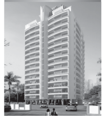
HILL CREST Residential Apartment Ladyhill, Mangalore 3 BHK: 1989, 2260, 2288 sft