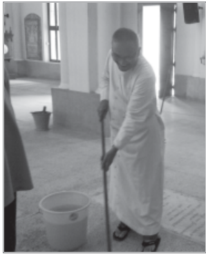
ಇಗರ್ಜೆ ನಿತಳ್ ಕಾರ್ಯಾಂತ್ ಆಮ್ಚೆ ಸಂಗಿಂ ಖಾಲ್ತೊ ಸೆವಕ್ ಜಾವ್ನ್ ಆಮ್ಚೊ ಲೋಕಾ ಮೊಗಾಳ್ ಗೊವ್ವಿಬಾಪ್